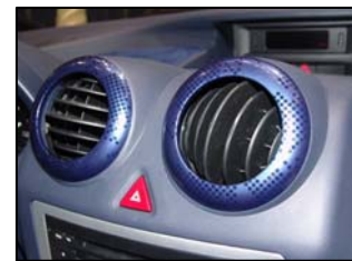
CAST FORMING® Injected part, wrapped with decorative adhesive film