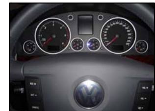
Chromed dashboard finish Volkswagen Touareg