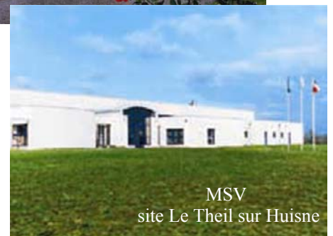
MSV site Le Theil sur Huisne