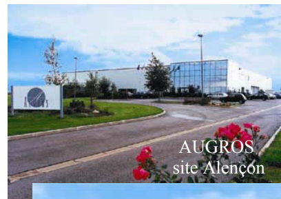
AUGROS site Alençon